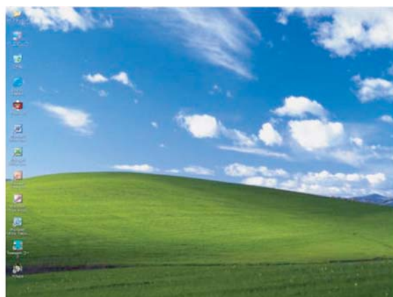
【ログオン完了画面】

※ユーザ ID とパスワードのの入力を 5 回以上間違えるとユーザ ID がロックされ、数分間ログオンできなくなります。