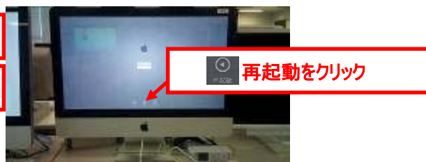
ログオン待ちの状態の場合 ※システム終了をクリックしないで下さい。