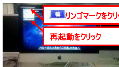
ログオン済みの状態の場合

MacOSが『ログオン済みの状態』の場合は画面左上の『リンゴマーク』をクリック→『再起動』をクリックします。 『ログオン待ちの状態』の場合は画面下の『再起動』ボタンをクリックします。